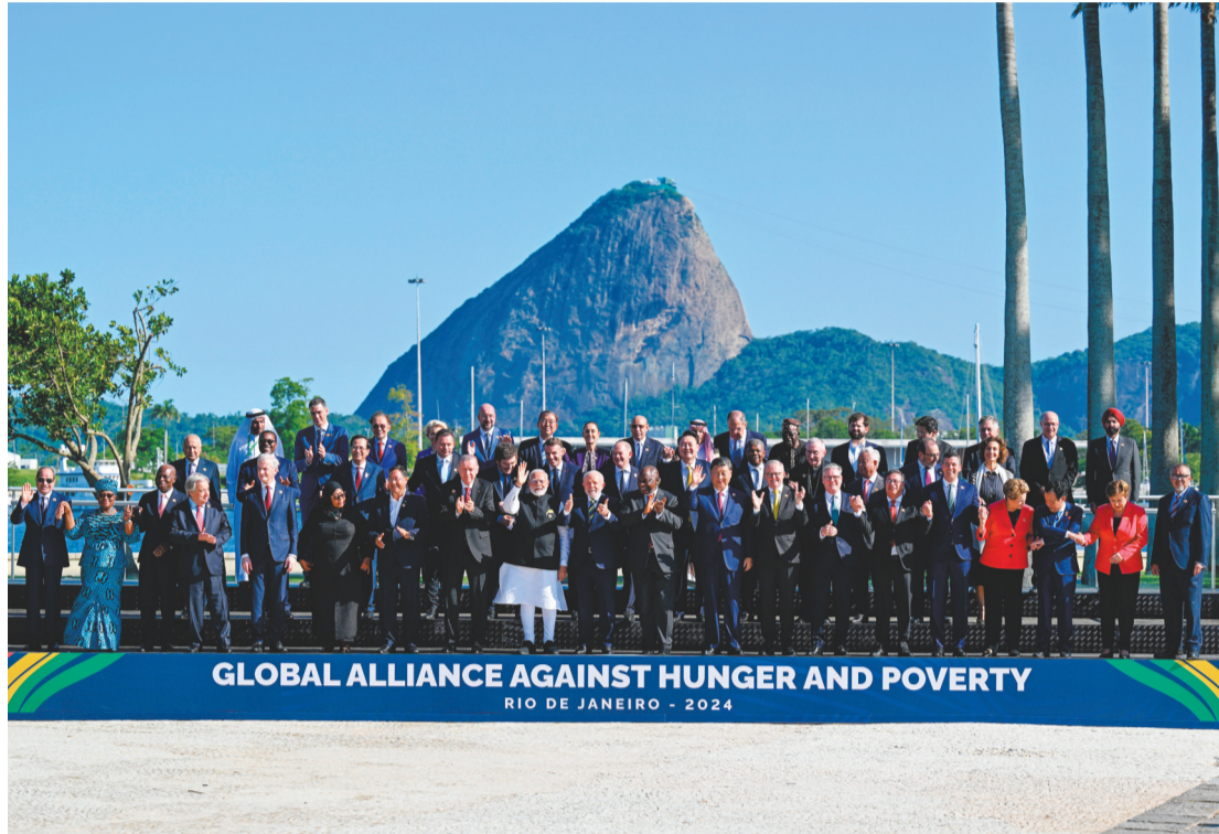
当地时间11月18日上午,国家主席习近平在巴西里约热内卢出席二十国集团领导人第十九次峰会。峰会把“构建公正的世界和可持续发展的星球”作为主题,并决定成立“抗击饥饿与贫困全球联盟”。这是习近平同与会领导人共同参加巴方发起的“抗击饥饿与贫困全球联盟”合影。

新华社里约热内卢11月18日电(记者倪四义 姜岩)当地时间11月18日上午,国家主席习近平在巴西里约热内卢出席二十国集团领导人第十九次峰会。 在峰会第一阶段围绕“抗击饥饿与贫困”议题讨论时,习近平发表题为《建设一个共同发展的公正世界》的重要讲话。 习近平指出,当今世界百年变局加速演进,人类发展面临的机遇和挑战前所未有。作为世界主要大国领导人,我们应该不畏浮云遮望眼,秉持命运与共的共同体意识,扛起历史责任,展现历史主动,推动历史进步。中国主办二十国集团领导人杭州峰会时,首次将发展议题放到宏观经济政策协调的中心位置,这次里约热内卢峰会把“构建公正的世界和可持续发展的星球”作为主题,并决定成立“抗击饥饿与贫困全球联盟”。从杭州到里约热内卢,我们都致力于同一个目标,即建设一个共同发展的公正世界。 为了建设这样的世界,我们要在贸易投资、发展合作等领域增加资源投入、做强发展机构,多一些合作桥梁,少一些“小院高墙”,让越来越多发展中国家过上好日子、实现现代化;要支持发展中国