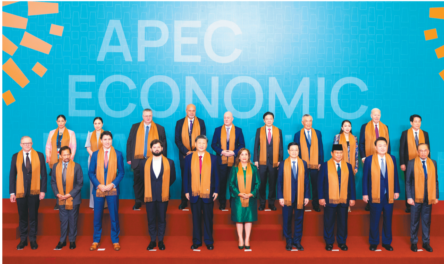
当地时间11月16日上午,亚太经合组织第三十一次领导人非正式会议在秘鲁利马会议中心举行。这是习近平同其他亚太经合组织成员经济体领导人、代表合影。

新华社利马11月16日电(记者倪四义 姜岩)当地时间11月16日上午,亚太经合组织第三十一次领导人非正式会议在秘鲁利马会议中心举行。国家主席习近平出席会议并发表题为《共担时代责任 共促亚太发展》的重要讲话。