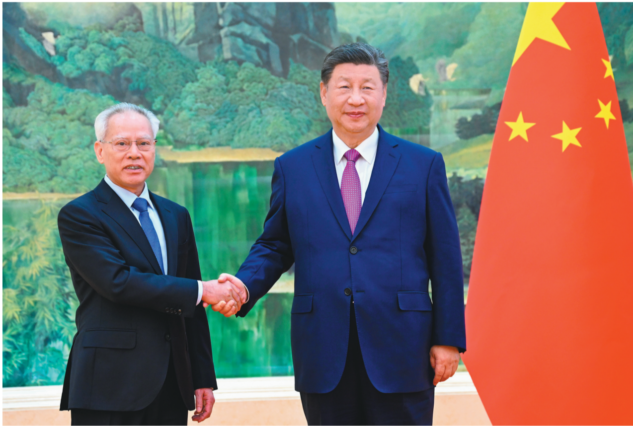
图为国家主席习近平会见新当选并获中央政府任命的澳门特别行政区第六任行政长官岑浩辉。

新华社北京11月1日电 国家主席习近平11月1日下午在人民大会堂会见了新当选并获中央政府任命的澳门特别行政区第六任行政长官岑浩辉。 在习近平的见证下，国务院总理李强向岑浩辉颁发了任命他为中华人民共和国澳门特别行政区第六任行政长官的国务院第794号令。 习近平对岑浩辉获中央政府任命为澳门特别行政区第六任行政长官表示祝贺。习近平说，你曾长期担任终审法院院长，爱国爱澳立场坚定，依法履职、恪尽职守，为澳门繁荣稳定作出了积极贡献。你参选行政长官以来，展现出务实亲民、敢于直面问题的良好形象，参选政纲和施政理念符合澳门实际，符合广大澳门居民对美好生活的期盼。你在行政长官选举中获得高票提名、高票当选，表明澳门社会对你的广泛认同和支持。中央对你充满信心。 习近平表示，“一国两制”是符合国家、民族根本利益，符合澳门根本利益的好制度。澳门回归祖国25年来，在中央和祖国内地大力支持下，特别行政区政府和澳门各界接续奋斗，具有澳门特色的“一国两制”实践取得举世瞩目成就，宪法和澳门基本法确立的特别行政区宪制秩序牢固树立，澳门各项事业全面进步，国际影响力显著提升。中央将继续全面准确、坚定不移贯彻“一国两制”、“澳人治澳”、高度自治的方针，确保不会变、不走样。（下转第二版）