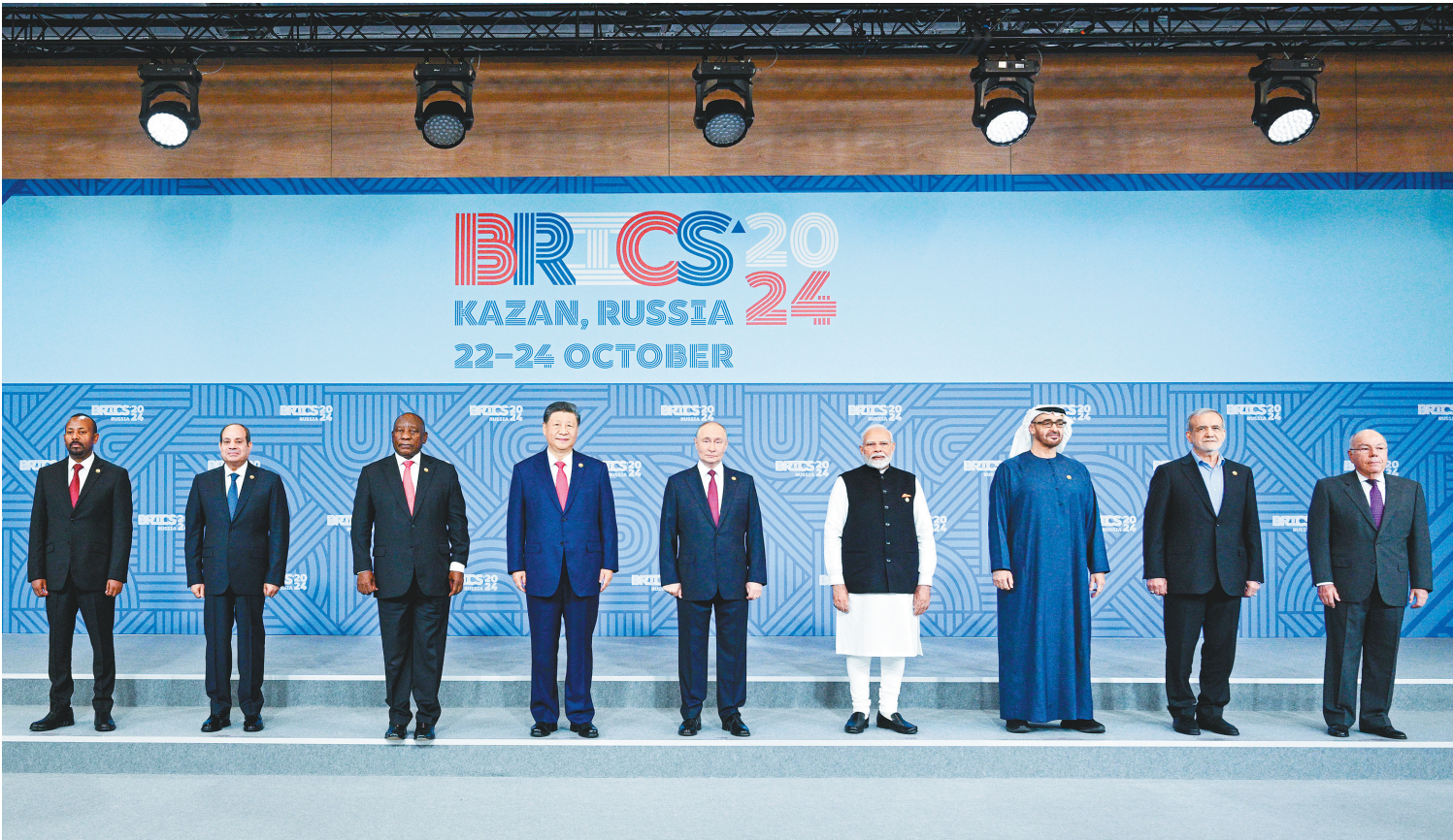
当地时间10月23日上午，金砖国家领导人第十六次会晤在喀山会展中心举行。这是会晤期间，金砖国家领导人集体合影。

动，坚守开放包容、合作共赢的初心使命，顺应全球南方崛起大势，坚持求同存异、同心同德，进一步凝聚金砖国家共同价值，维护金砖国家共同利益，促进金砖国家联合自强，把金砖打造成促进全球南方团结合作的主要渠道、推动全球治理变革的先锋力量。 习近平强调，世界越是动荡，我们越要高举和平、发展、合作、共赢旗帜，淬炼金砖成色，展现金砖力量。要发出和平之声，倡导对话而不对抗、结伴而不结盟的新型安全。要共谋发展之路，倡导普惠包容的经济全球化，坚守共同发展的道路。要夯实合作之基，深化农业、能源、矿产、经贸等传统领域合作，拓展绿色低碳、人工智能等新兴领域合作，维护贸易投资和金融安全。 随后，习近平出席大范围会议，就未来金砖发展发表重要意见，提出五点建议。