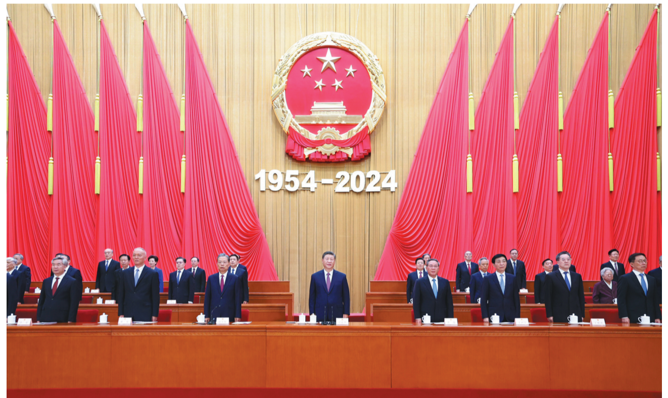
9月14日上午,中共中央、全国人大常委会在北京人民大会堂隆重举行庆祝全国人民代表大会成立70周年大会。习近平、李强、赵乐际、王沪宁、蔡奇、丁薛祥、李希、韩正等出席大会。

新华社北京9月14日电 中共中央、全国人大常委会14日上午在人民大会堂隆重举行庆祝全国人民代表大会成立70周年大会。中共中央总书记、国家主席、中央军委主席习近平出席会议并发表重要讲话。他强调,要进一步坚定道路自信、理论自信、制度自信、文化自信,发展全过程人民民主,坚持好、完善好、运行好人民代表大会制度,为实现新时代新征程党和人民的奋斗目标提供坚实制度保障。 中共中央政治局常委李强、王沪宁、蔡奇、丁薛祥、李希,国家副主席韩正出席。中共中央政治局常委、全国人大常委会委员长赵乐际主持大会。