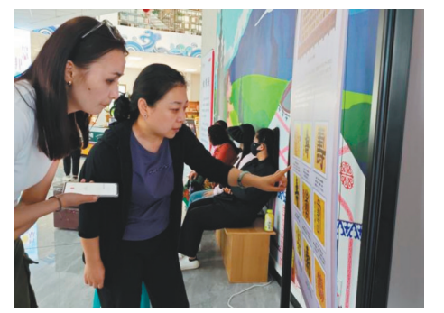
观众通过展板仔细欣赏“王尔烈七十寿屏”。

本报讯 记者刘海博报道 近日,“八千里路·双向奔赴”辽阳古代历史图片特别展在新疆塔城市额敏县·也迷里文化园举行。展览以200余幅照片和“王尔烈七十寿屏”为载体,带观众感受辽阳的历史文化。