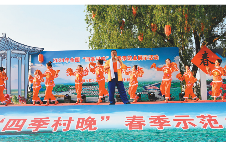
展现自家特产的歌伴舞《辽中大米喷喷香》收获了观众阵阵掌声。