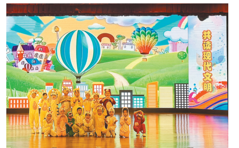
幼儿园小朋友表演绘本《猜猜我有多爱你》。

本报讯 记者杨亮报道 好书和阅读在童年里散发的书香,是孩子们成长最好的礼物。六一国际儿童节到来之际,辽宁省图书馆将举办“多彩童年,快乐阅读——让孩子发现图书馆”六一国际儿童节系列阅读活动。