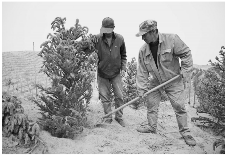
5月29日，工人在杭锦旗穿沙公路两侧植树造林。当日，在内蒙古鄂尔多斯市杭锦旗黄河“几字弯”荒漠化综合治理库布其沙漠治理现场，工人在穿沙公路两侧植树造林、工程机械推平沙漠为光伏装机做准备。杭锦旗对库布其沙漠采取“北缘锁边、南部围堵、西部封禁、中部切割、东部削平”的治理措施，力争实现荒漠化、沙化土地面积持续“双缩减”。