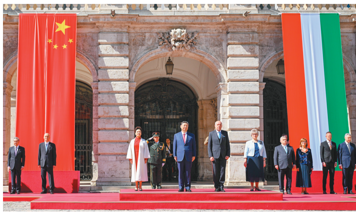
当地时间5月9日上午,国家主席习近平在布达佩斯出席匈牙利总统舒尤克和总理欧尔班共同举行的隆重欢迎仪式。

新华社布达佩斯5月9日电 (记者陈浩 韩梁)当地时间5月9日上午,国家主席习近平在布达佩斯出席匈牙利总统舒尤克和总理欧尔班共同举行的隆重欢迎仪式。