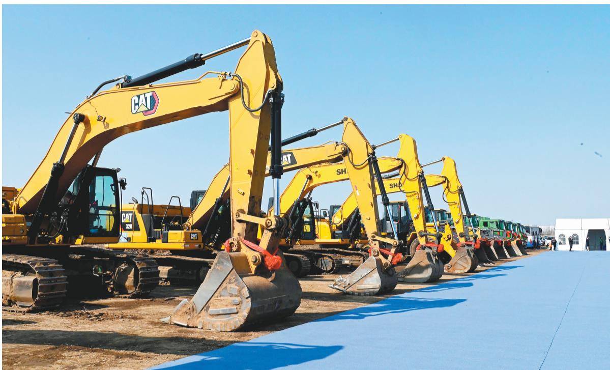
2024年一季度重点项目集中开工动员大会现场。

着眼提升维护国家“五大安全”能力,动态完善20个工程包,以实实在在的项目形成对国家重大战略的强有力支撑;谋划储备更多经济效益、社会效益突出的好项目;围绕构建具有沈阳特色优势的现代化产业体系,聚焦20条重点产业链和10个重点产业集群建设等,深化央地合作,逐个项目跟踪服务、推进落地;积极吸引优质民营企业、外资企业,大力吸引龙头企业投资布局;瞄准培育壮大新质生产力,在以科技创新推动产业创新上下更大功夫,通过场景招商、基金招商等方式,吸引创新要素加快集聚,激发航空航天、低空经济、新能源及新型储能、数字经济、绿色发展等新产业新业态新赛道爆发点。