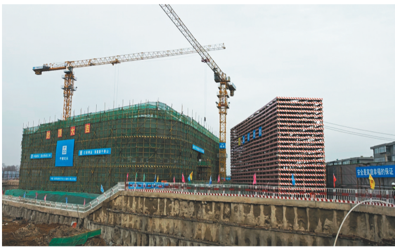
沈阳智能计算中心新基建项目全面复工正加速建设。

沈阳浑南科技城建设火热忙碌,未来将成为新质生产力发展示范区;辽宁汉京半导体产业基地项目开工建设,建成后推动辽宁成为半导体设备重要材料供应基地;沈阳智能计算中心新基建项目加速施工,为沈阳构建北方地区算力新高地提供支撑;中科科工大型无人机等25个重大项目签约,进驻沈阳航空航天城……一批批项目拔地而起,一个个项目加速落地。如今的沈阳,传统优势产业焕发新生,战略性新兴产业欣欣向荣,新质生产力