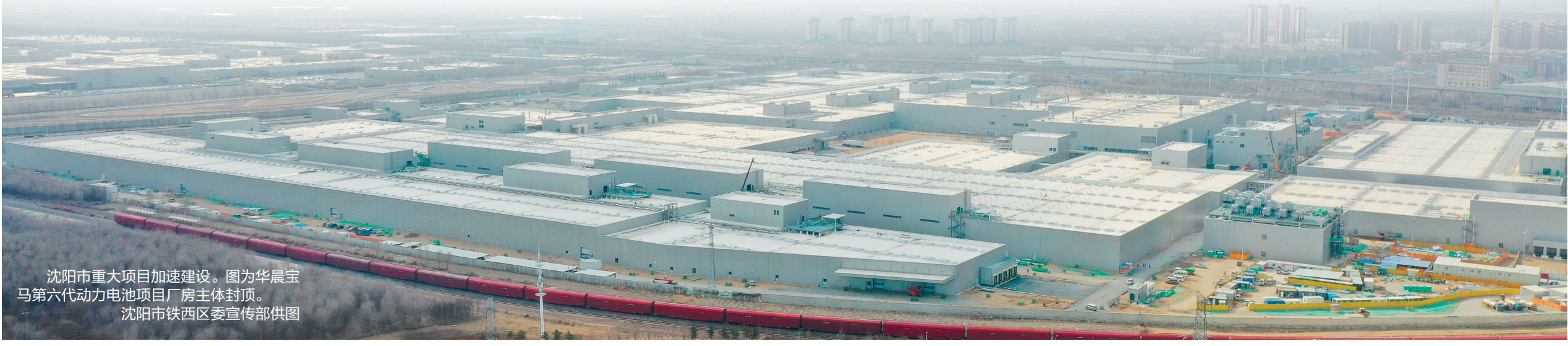
沈阳市重大项目加速建设。图为华晨宝马第六代动力电池项目厂房主体封顶。

鼓励建筑业企业联合体参与项目建设。鼓励央企在沈阳市将具备条件的分公司改制为独立法人子公司,并支持央企与沈阳市本地企业组建联合体参与重大项目工程建设。政府投资项目应允许采用联合体投标,投标活动中,类似业绩原则上不作为投标人参与投标的门槛条件。联合体任一成员有同类业绩的,即可认同为联合体业绩,在以联合体形式参与新项目申报时对该业绩予以认可。