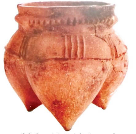
夏家店下层文化时期鬲,三足空心,是鬲的繁荣时期。(北票博物馆藏)