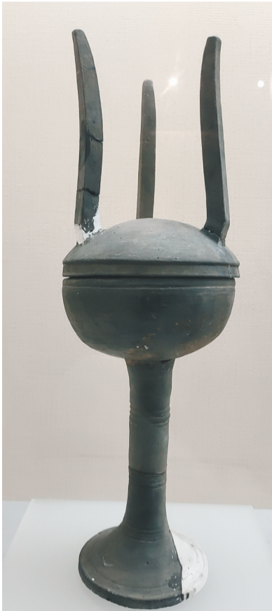
徐往子战国墓出土的陶鬲。(辽阳博物馆藏)

“燕式鬲”出现在古辽东地区的太子河畔,正是燕国这种发展策略的反映。在当时,有相当数量的燕地居民携家带口进入古辽东地区,既带来了中原地区的先进文化,又为燕国的北向发展建立了社会、经济乃至文化基础。这一策略在燕昭王时达到高峰,他派大将秦开却胡千余里,自西向东设立上谷、渔阳、右北平、辽西、辽东五郡,古辽东地区由此正式纳入燕国的版图当中。