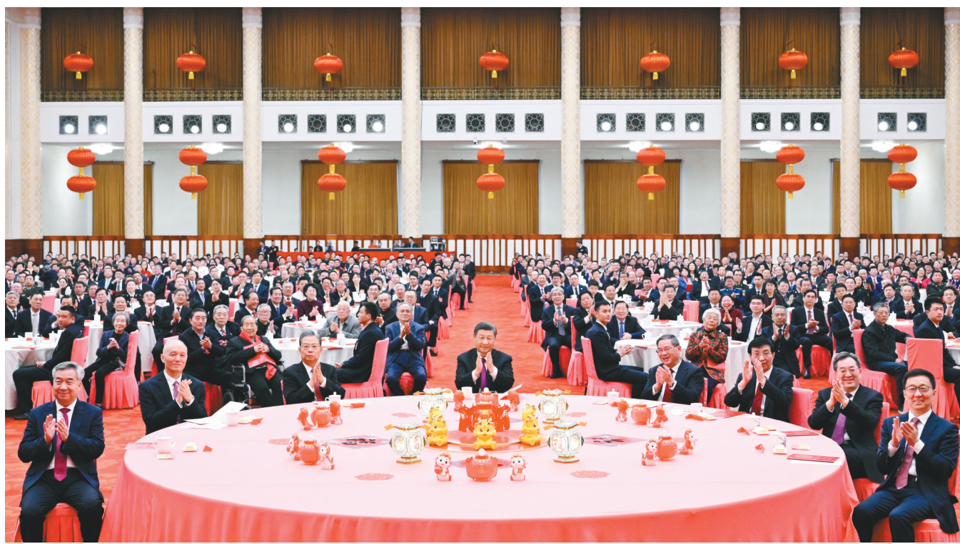
图为党和国家领导人习近平、李强、赵乐际、王沪宁、蔡奇、丁薛祥、李希、韩正等同首都各界人士齐聚一堂,共迎新春。

新华社北京2月8日电 中共中央、国务院8日上午在人民大会堂举行2024年春节团拜会。中共中央总书记、国家主席、中央军委主席习近平发表讲话,代表党中央和国务院,向全国各族人民,向香港特别行政区同胞、澳门特别行政区同胞、台湾同胞和海外侨胞拜年。 习近平强调,即将过去的癸卯兔年,是全面贯彻党的二十大精神、全面建设社会主义现代化国家新征程上迈出坚实步伐的一年。面对异常复杂的国际环境和艰巨繁重的改革发展稳定任务,我们以中国式现代化凝心聚力,统筹国内国际两个大局,顽强拼搏、勇毅前行,战胜多重困难挑战,在全面建设社会主义现代化国家新征程上迈出坚实步伐。 李强主持团拜会,赵乐际、王沪宁、蔡奇、丁薛祥、李希、韩正等出席。