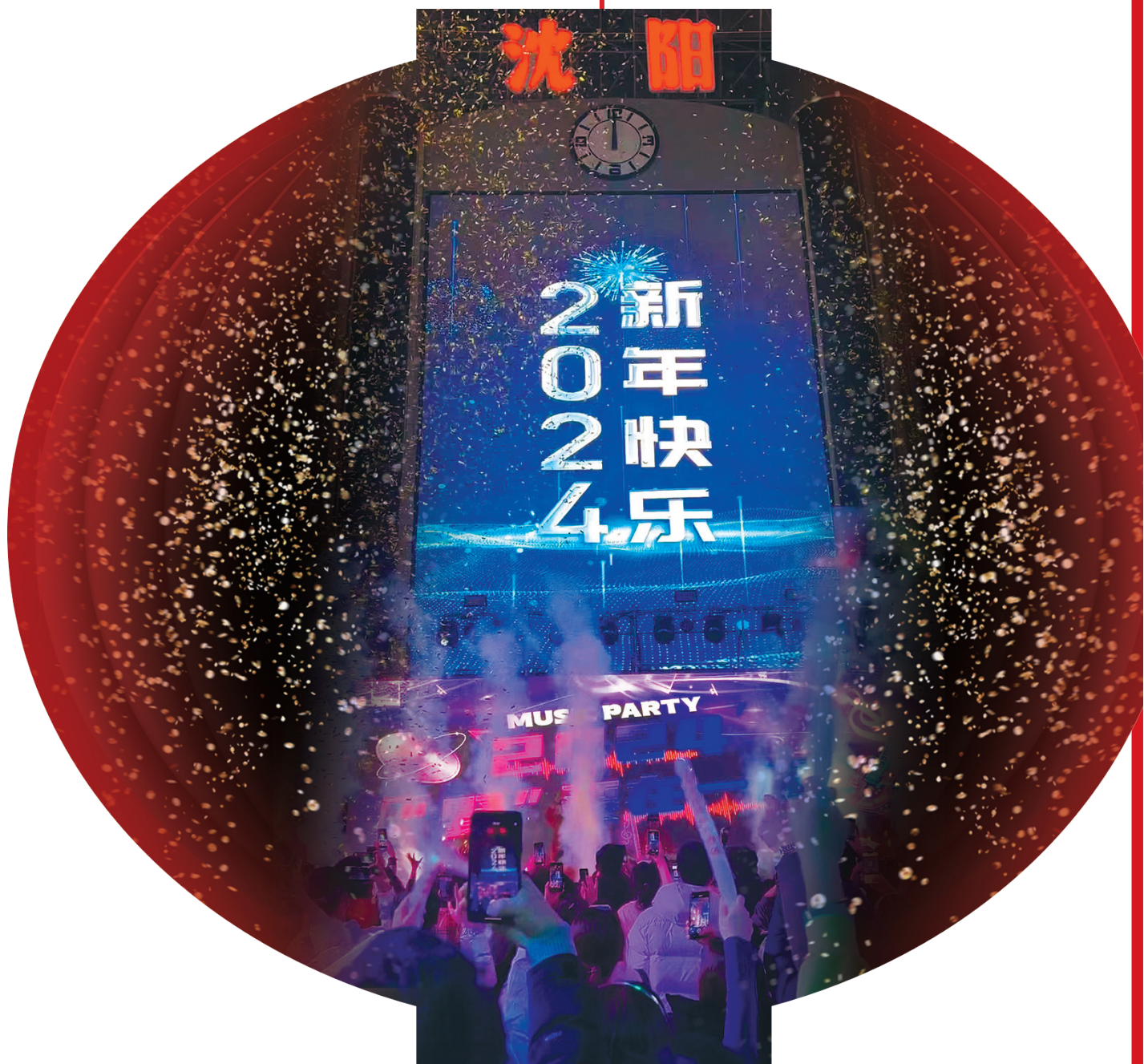
今年的跨年夜，盛京百货大家庭的狂欢音乐派对一直持续到零点后。

在未来，夜经济将会更深度地与城市历史文化融合，展示城市文化底蕴，为所有人提供更多元化的夜生活。很快会有越来越多的人愿意卸下白天的疲惫，在夜里走出家门，去感受城市夜未眠的魅力！