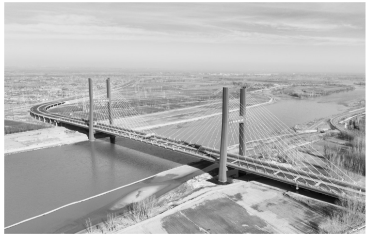
11月28日,由中国铁建大桥局承建的宁夏“十四五”交通重点工程——中卫下河沿黄河公路大桥正式建成通车。中卫下河沿黄河公路大桥工程位于中卫市沙坡头区,大桥主桥全长1228米,是宁夏已建成的第20座黄河公路大桥。图为中卫下河沿黄河公路大桥。新华社记者 刘海摄