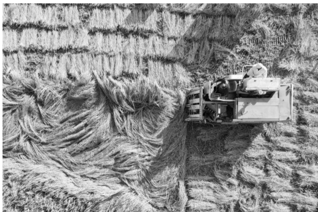
秋去冬来,日照渐短。天山南北,时间沉淀出浓墨重彩。

秋天最美是丰收。万亩稻田机器轰鸣,枝头藤间硕果累累。铁路口岸热火朝天,向西开放活力旺盛。