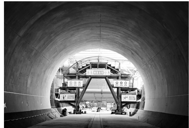
雄忻高铁雄安新区地下段项目建设现场(11月24日摄)。

目前,由中铁四局等单位承建的雄忻高铁雄安新区地下段项目正加紧施工,参建单位严格把控施工节点计划,有序推进项目建设。雄忻高铁是我国“八纵八横”高速铁路网京昆通道的重要组成部分,线路东起京雄城际铁路雄安站,西至大西高铁忻州西站,正线全长342公里,设计时速350公里。