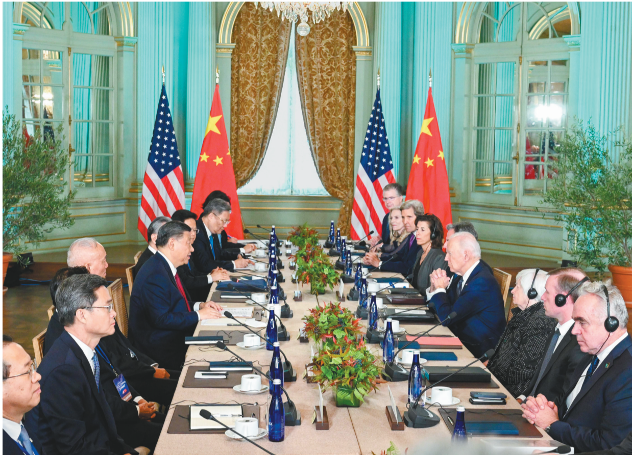
当地时间11月15日,国家主席习近平在美国旧金山斐洛里庄园同美国总统拜登举行中美元首会晤。