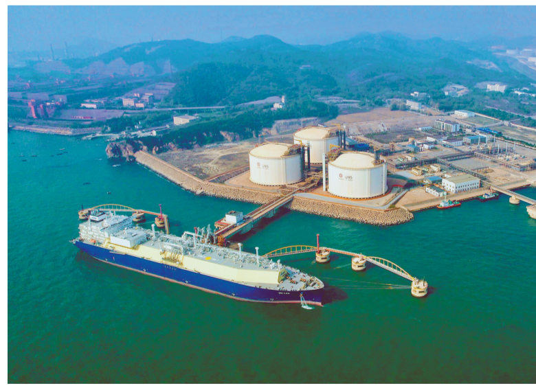
图为运输船在LNG接收站专用码头完成返装后准备启航。