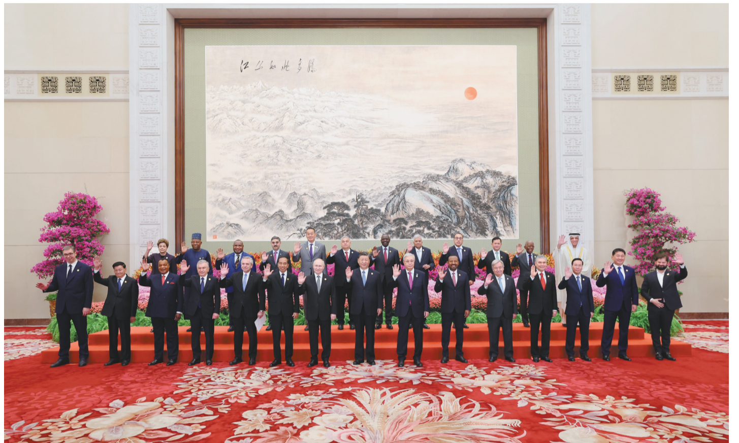
10月18日上午,习近平同出席高峰论坛的外国国家元首、政府首脑和国际组织负责人等国际贵宾集体合影。新华社记者 黄敬文 摄

新华社北京10月18日电(记者徐铭 孙奕)10月18日上午,国家主席习近平在人民大会堂出席第三届“一带一路”国际合作高峰论坛开幕式并发表题为《建设开放包容、互联互通、共同发展的世界》的主旨演讲。习近平宣布中国支持高质量共建“一带一路”的八项行动,强调中方愿同各方深化“一带一路”合作伙伴关系,推动共建“一带一路”进入高质量发展的新阶段,为实现世界各国的现代化作出不懈努力。 金秋时节,天高气爽,风清气朗。天安门广场上,共建“一带一路”国家国旗迎风飘扬,相映成辉。 出席高峰论坛的外国国家元首、政府首脑和国际组织负责人等贵宾陆续抵达。人民大会堂东门大厅两侧大屏幕上,“一带一路”项目鎏金十年硕果累累。 习近平同出席开幕式的外方领导人集体合影。 在《和平—命运共同体》乐曲中,习近平同外方领导人一同步入会场。全场起立热烈欢送。 习近平主席发表题为《建设开放包容、互联互通、共同发展的世界》的主旨演讲。