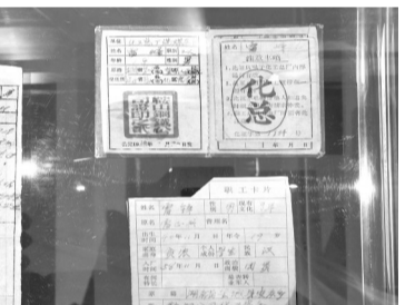
雷锋在鞍钢化工总厂工作期间的职工证。