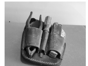
雷锋在鞍钢化工总厂工作期间使用过的工具。

开展当天,雷锋的家乡、工友易秀珍特意赶来参观,看到一件件展品非常激动,想起65年前与雷锋坐一趟火车来到鞍钢工作的一幕幕往事眼含热泪。展厅里还展出了一份雷锋绘制的推土机电路图,鞍钢博物馆布展管理部部长陈永向记者介绍,这是1958年11月,雷锋被分配到鞍钢化工总厂洗煤车间当学徒工、学习驾驶推土机时的成果。雷锋在《我学会开推土机》一文中,回顾了这段经历。起初雷锋有点想不通,找到车间主任于明谦说:“我是一心一意为祖国