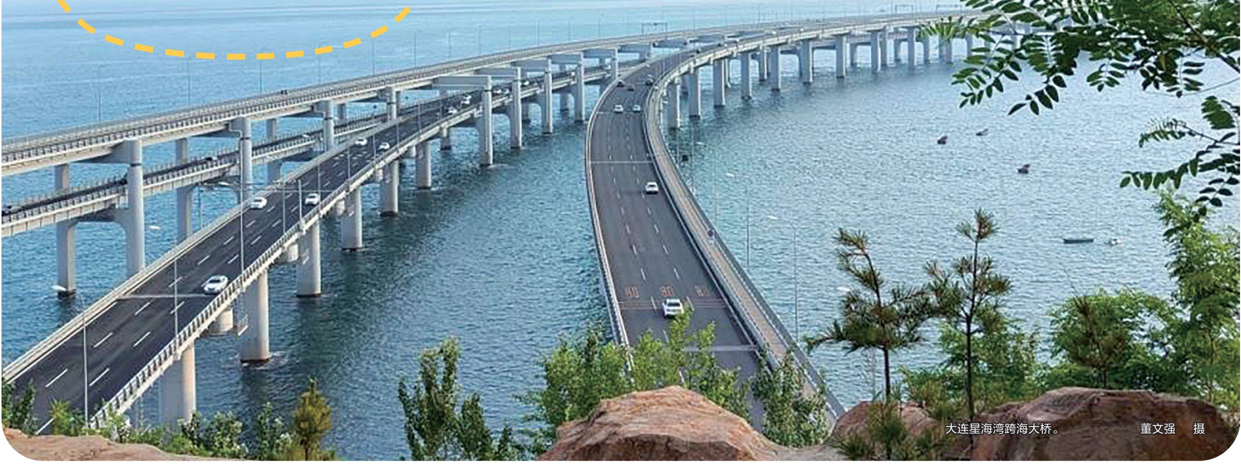
大连星海湾跨海大桥。