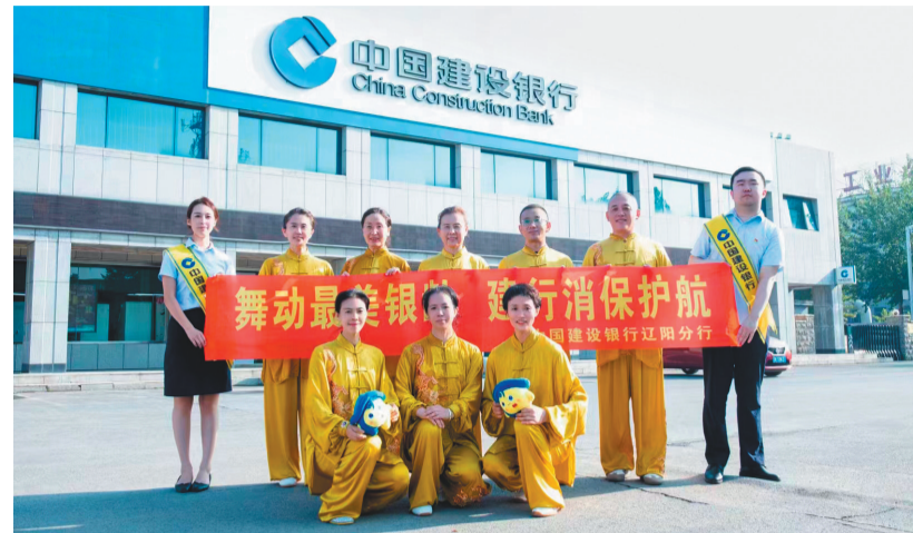
建设银行辽阳分行通过组织老年人太极拳大赛活动宣传金融知识。

建设银行工作人员提醒消费者注意新骗局——网上所谓“法律顾问”为客户解决多年债务问题预先收取办案费骗局、假冒狱警电话告知犯人向法院汇款的骗局、假冒一起工作的工友求救汇款的骗局、花钱恢复征信的骗局、冒充远在海外的亲人在微信上联系亲属要买回国机票因微信交易被限制无法给黄牛转账的骗局……2023年，针对“一老一小”、新市民等易受诈骗群体，建行辽宁省分行精准目标、精准投放，提升宣教效果，线上线下开展活动4000多次；成功阻截各类诈骗涉案事件378件，为客户避免经济损失合计达1271.63万元。建设银行工作人员时刻提醒客户要牢记防骗“四不”——不理睬、不轻信、不转账、不汇款！