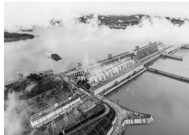
9月24日在湖北省宜昌市秭归县茅坪镇拍摄的三峡大坝(无人机照片)。当日，一场秋雨过后，三峡大坝上空云雾缭绕，美景如画。