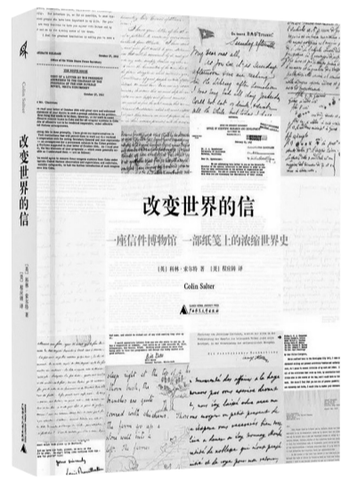
一封伽利略写于1609年的信,描写了他通过望远镜观察到木星的多颗卫星。他还通过莱特兄弟在他们历史性的首次飞行后