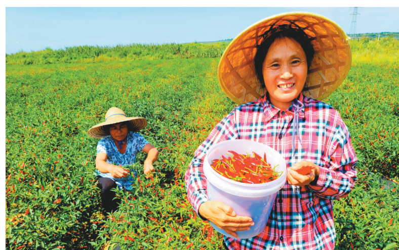
丰收季,沈抚示范区拉古满族乡农户正在采摘辣椒。

业观摩会上为农户加油打气:“我们要继续做好农业产业化这篇大文章,着力打造拉古满族乡特色农业品牌,促进农民增产增收,把这看似