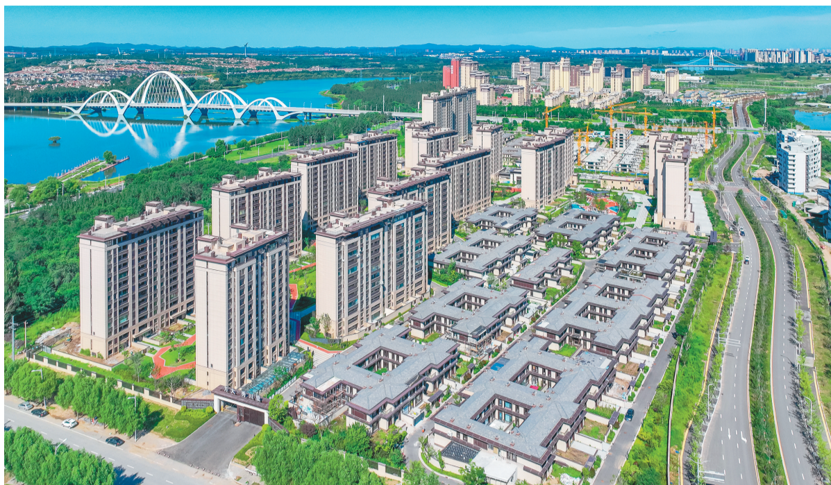
俯瞰生物物的沈抚示范区。

为提升政策执行力,打通政策落地“最后一公里”,沈抚示范区依照“于法周延、于事简便”的原则,编制《实施细则》《解答手册》以及《兑现管理办法》三个配套文件,形成相互贯通、相互支撑、全过程政策实施体系,进一步推动产业政策直达快享、应享尽享。