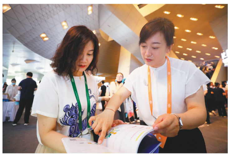
第24届中国海外学子(大连)创业周上,沈抚示范区提供多项政策招揽海内外人才。

栽得梧桐树,引来金凤凰。沈抚示范区党建工作部相关负责人表示,对于符合条件的人才,沈抚示范区将快捷兑现既定的优惠政策。相信本次政策的出台,能助力沈抚示范区建成东北地区推动人才高质量发展的政策高地、创新高地。