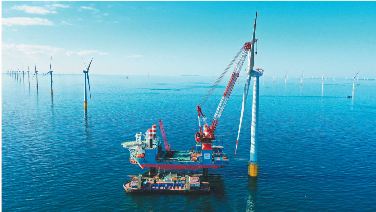
华能大连庄河海上风电场址IV项目风机叶轮与主机电机对接。

精心打造的高质量项目群中,大连湾海底隧道、地铁5号线、梭鱼湾足球场、北站综合交通枢纽等重大基础设施项目完工投运;恒力聚酯科技产业园等重大项目发挥支撑性、引领性作用;新机场、大石化和大船坞升级改造等一批事关长远的重大项目全力推进。全市加速以重大项目建设推动“两先区”“三个中心”高质量发展,奋力当好新时代东北振兴“跳高队”、“辽沈战役”急先锋。