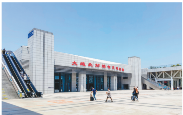
大连北站综合交通枢纽建成启用。本报特约记者 王华 摄