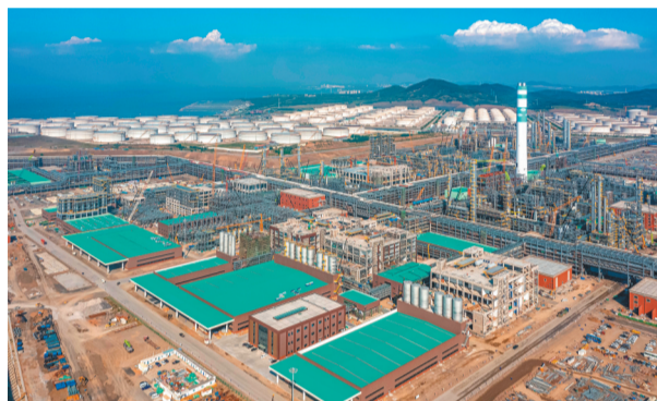
建设中的恒力聚酯科技产业园项目。