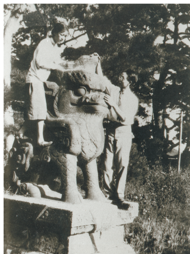
梁思成、林徽因在东北大学工作期间于北陵丈量时的合照。