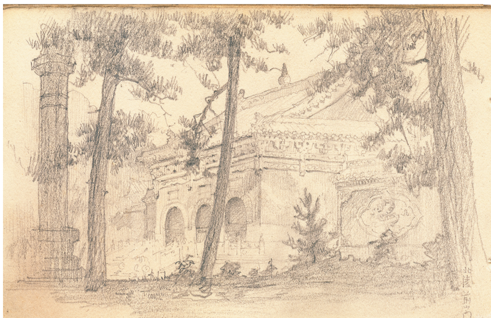
梁思成的沈阳北陵前门速写。

目前正在沈阳举办的“栋梁——一代建筑宗师梁思成学术文献展”，将梁思成和林徽因带回人们的视野。沈阳是梁林二人结婚后开启新生活的地方，尤其是东北大学，不仅是他们开始工作的地方，还是中国建筑学的起步之地。一幅幅照片，一封封信件，还原了夫妇二人在沈阳，在东北大学的生活工作情况。