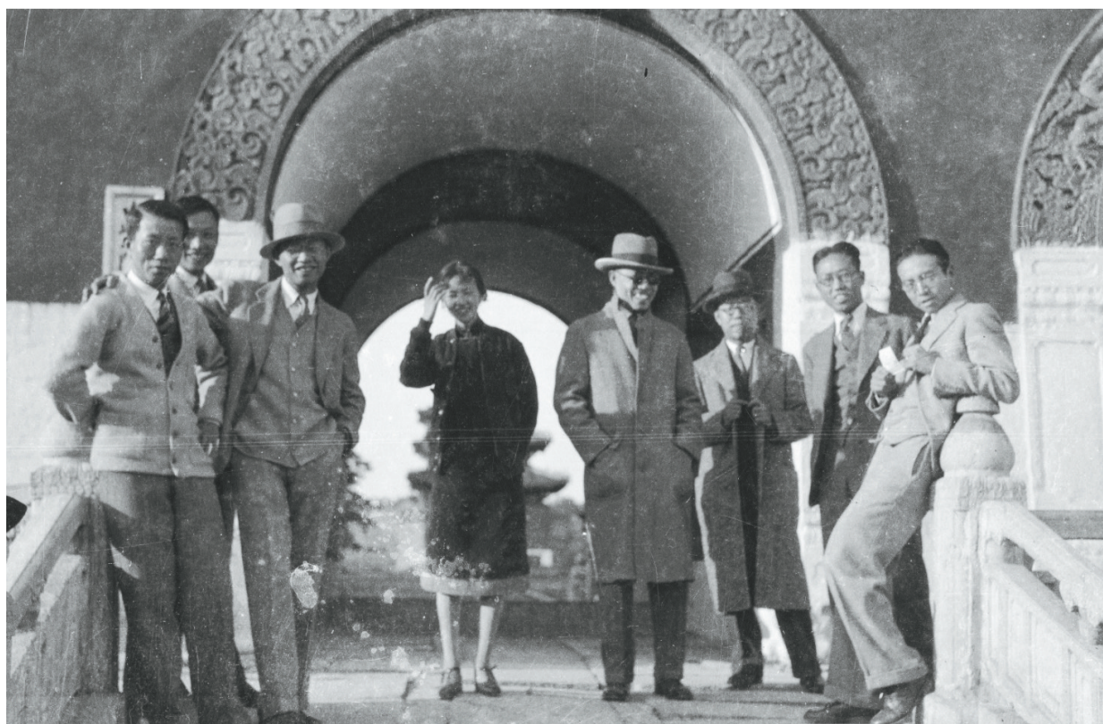
东北大学老师在沈阳北陵合影。其中右一为梁思成，中为林徽因，左一为蔡方荫。