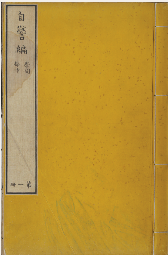
《自警编》的封面对比图。左为宋版不分卷本,右为宋版五卷本。

研究人员正是通过五卷本《自警编》的版本特征,确定了不分卷本《自警编》的宋版书身世,成为一段佳话,至今仍被津津乐道。