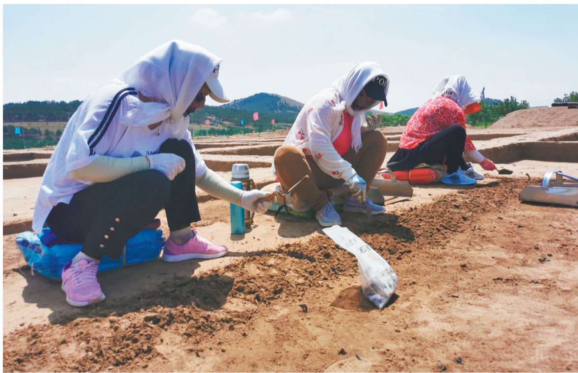
作为红山文化早期聚落址,近几年来,马鞍桥山遗址不断有新的发现。图为工作人员在马鞍桥山遗址发掘。

除了考古调查,红山文化考古发掘也取得了重要成果。马鞍桥山遗址是我省境内目前已发掘面积最大的一处新石器时代的聚落址,遗址年代延续较长,文化内涵丰富,包含有兴隆洼文化、红山文化早、中期遗存,绝对年代为距今5500年至7700年。在马鞍桥山,除了发现几千年前先民居住的房址外,还发现了祭祀区。祭祀区域内有燎祭遗迹和祭祀坑,祭祀坑内有与农业生产相关的陶、石器祭祀品,还有鹿科动物骨骼和贝类。此外,在一处大型祭祀坑内,考古工作者还发现了整套的农业工具,包括播种用的石耜(犁)、收割用的石刀、加工谷物使用的石磨盘和石磨棒,其中一件石耜涂有红色颜料。