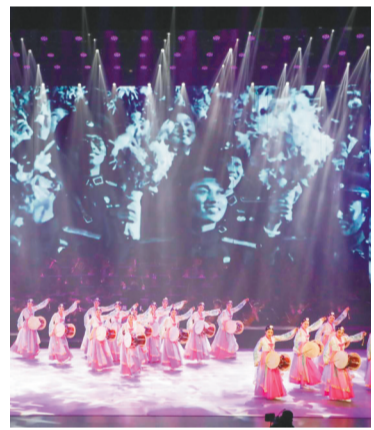
《光荣·梦想》演出现场。

让人倍感新奇的是,该剧打破了传统舞台模式,交响乐团作为舞台背景全程进行演奏,同时还穿插了表演、演唱、舞蹈、朗诵、音乐剧等