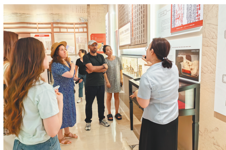
“古籍保护与传承特展”吸引了大量观众,图为工作人员为外国观众讲解。

8月22日,由国家图书馆(国家古籍保护中心)主办的“江流万古文润千年——2023年中华传统晒书活动启动仪式”在江苏省扬州市图书馆举行,作为此次全国晒书活动的组成部分,辽宁省图书馆举办“继往开来 国韵书香——辽宁省图书馆古籍保护与传承特展”巡展活动。省图联合沈阳、大连、鞍山、铁岭、丹东等公共图书馆和沈阳大学、辽宁中医药大学等高校举行线上线下巡展活动,向大众展示、推广古籍和推动古籍保护,让馆藏的珍贵古籍走进大众视野。据悉,此次活动将持续一个月。