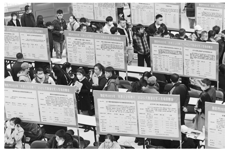
日前,由朝阳市人力资源和社会保障局、朝阳市退役军人事务局联合主办的“民营企业服务月”启动仪式暨退役军人专场招聘会,在朝阳万达广场举行。此次招聘会为退役军人量身打造了一批就业岗位,以此帮助退役军人实现高质量充分就业,促进退役军人在经济社会发展中再立新功。刘俊颖 本报特约记者 仇一军 摄