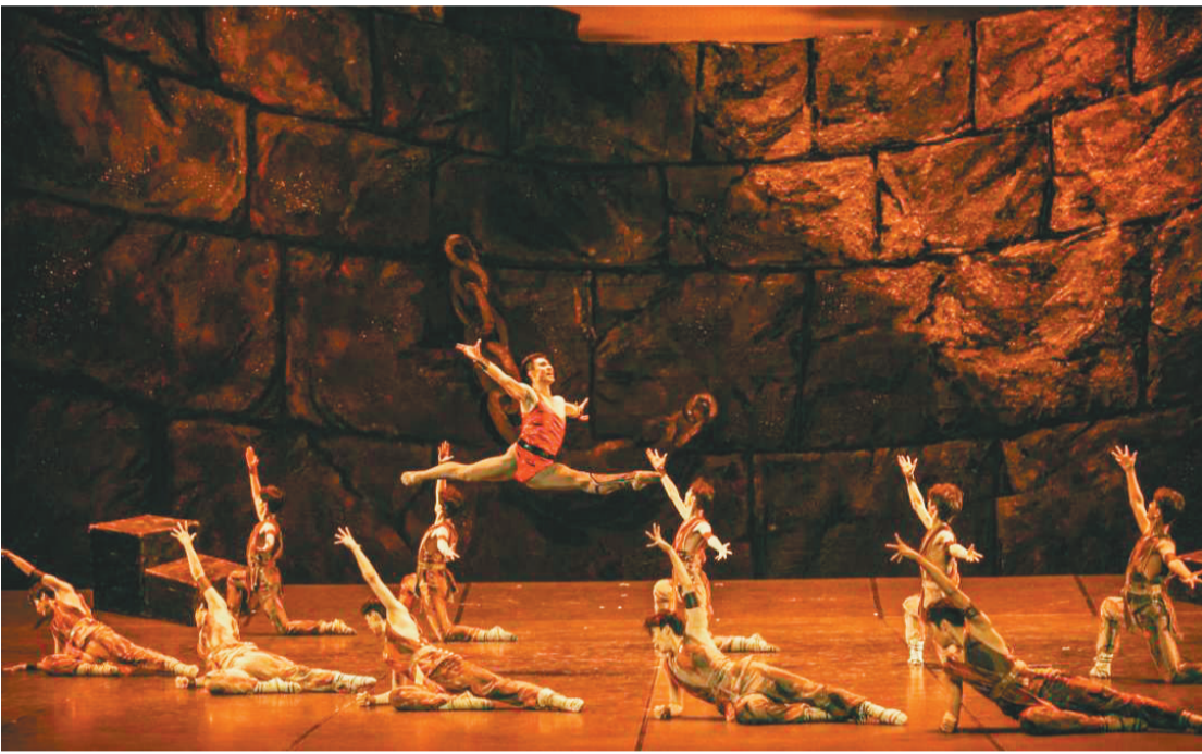
辽芭演绎的《斯巴达克》粗犷豪迈,充满阳刚之美,获得了无数好评。

还记得,2013年12月9日,《斯巴达克》在国家大剧院首演。此后,一路走过国内多个城市,并到俄罗斯、墨西哥等国家巡演。站在10年这个时间节点上,《斯巴达克》开启新一轮巡演。这部舞剧为何能火10年?我们在与主创、演员、观众的交流中,寻找答案。