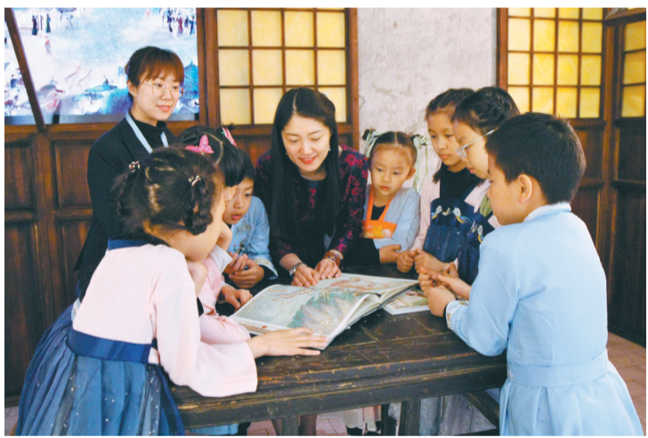
展览上,工作人员为孩子们讲解古籍绘本。

“这是黄道经纬仪,是南怀仁于1673年设计制造,重2752千克,高3.492米,最主要的功能是测量恒星的黄道坐标……”清代《新制