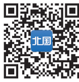
扫描二维码 关注本报APP