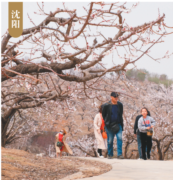
4月10日,沈阳市浑南区佟家峪村的千亩杏花竞相绽放,吸引大批游客前来游玩。