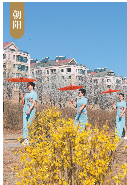
4月9日,朝阳市凌河湾湿地公园迎来游客赏花拍照。