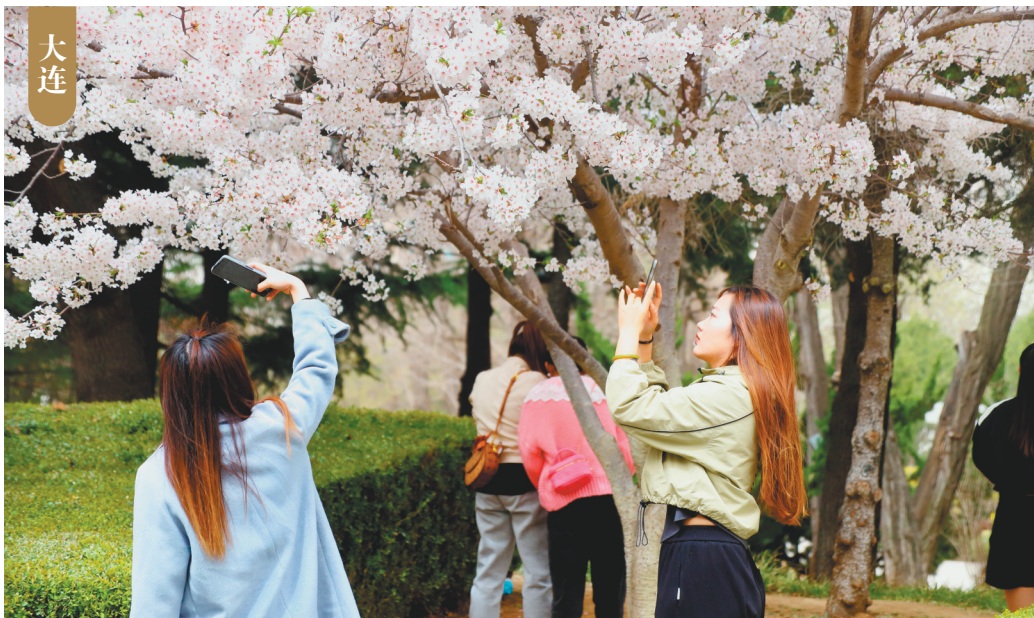
4月11日,大连劳动公园里樱花盛开,引得众多市民前来赏玩。