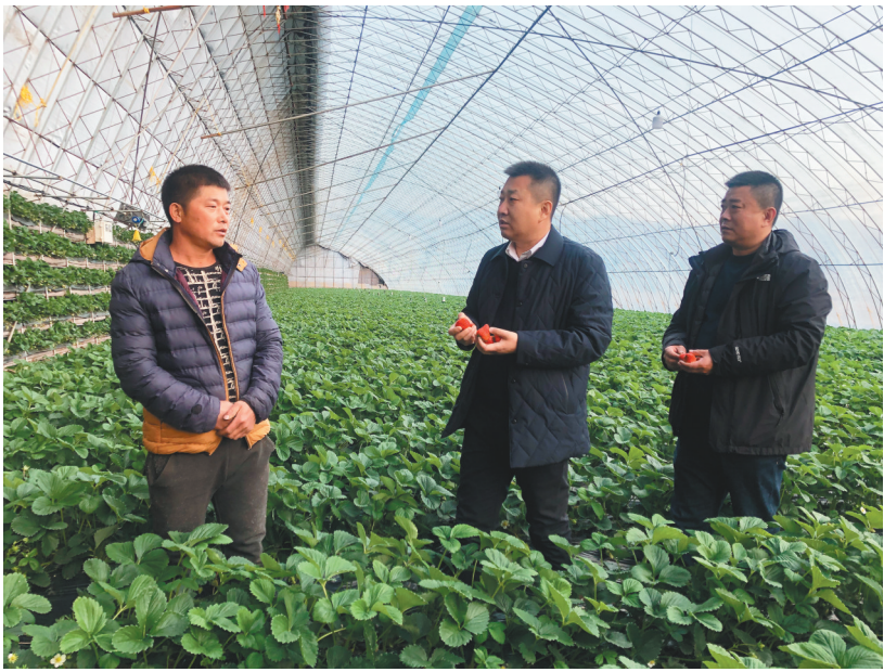
农行辽宁分行工作人员到本溪桓仁县雅河乡草莓种植大棚查看草莓生长情况。

为深入贯彻落实《辽宁全面振兴新突破三年行动方案(2023-2025年)》,有效激发经营主体活力,持续发挥服务实体经济主力军作用,切实履行国有大行责任担当,助力辽宁全面振兴,日前,中国农业银行辽宁省分行提出3方面、13项、23条具体工作举措,计划在2023-2025年投放不低于6000亿元信贷资金,为辽宁全面振兴提供重要金融支撑。