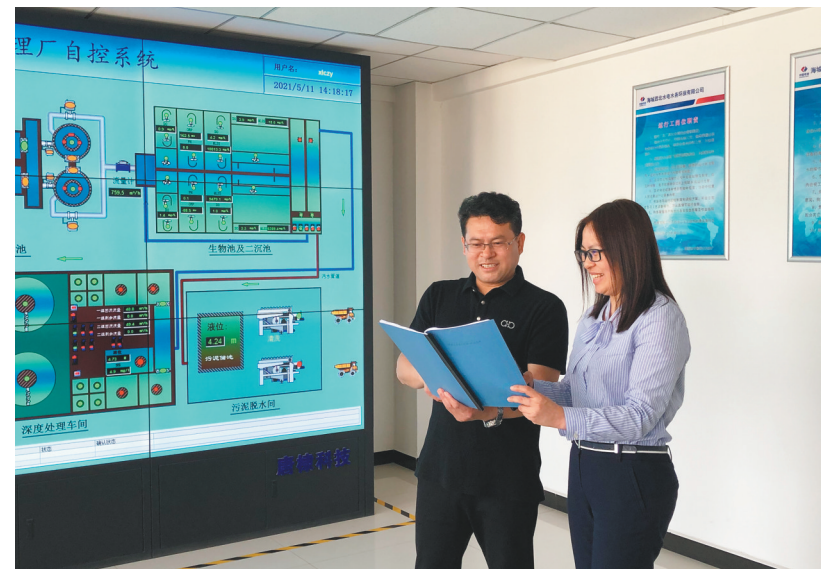
农行辽宁分行员工到鞍山海城西柳污水处理厂走访调研。

农行辽宁分行不断加大服务普惠民生力度,有效激发经营主体活力,确保供应链产业链稳定,全力支持产业链上下游协同发展。为有效解决小微企业融资难题,发挥农业银行线上产品多样化优势,持续推广“纳税e贷”“抵押e贷”“国担e贷”“政采e贷”等线上产品。推进小微金融业务下沉,设立普惠专营机构,网点内设立普惠金融服务专区,实现普惠业务“一站式”办理。未来三年,该行专项投放信贷资金不少于300亿元,全力支持普惠业务发展。加大个人消费贷款投放,有效促进消费。积极