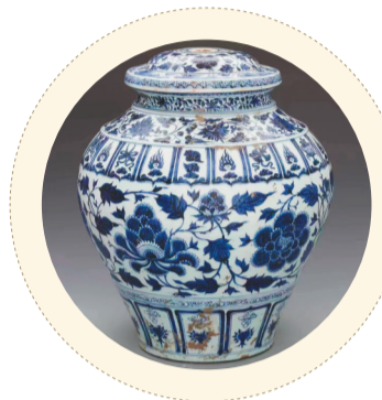
元青花缠枝牡丹纹盖罐