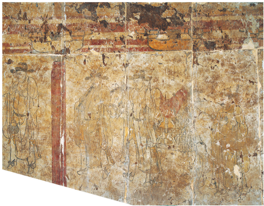
墓道南侧汉官“出行图”示意图

那么，画师为什么要后添加这个人物呢？表面上看，加上这个人物之后，墓道南北两壁的人数都成了14人，实现了人数的对称，但是深入研究后，人们发现更多的内容：经过近千年时光，这个人物身上不仅透出了车辕和驾辕骆驼的左后腿，还透出骆驼的生殖器。这说明，当时添加这个人物极有可能是为了遮盖不想展示或者不合适的壁画内容，只是经过千年时光，颜料褪色，遮盖部分露了出来。这也从侧面反映出北方画师高度写实的绘画风格，这一现象对于研究辽代绘画艺术具有重要意义。