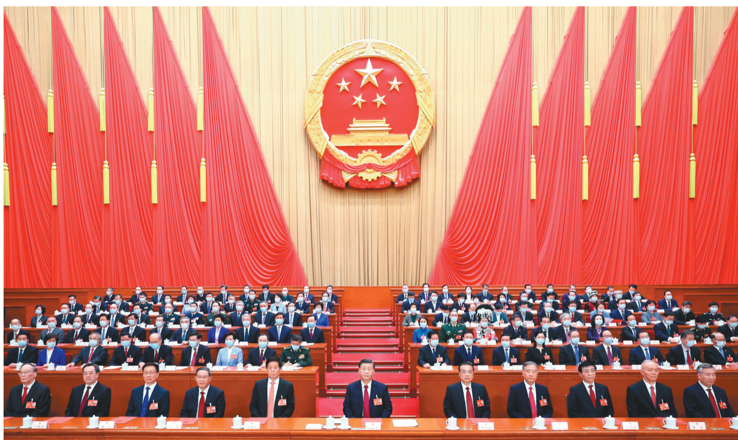
3月13日,第十四届全国人民代表大会第一次会议在北京人民大会堂闭幕。习近平等党和国家领导人在主席台就座。

新华社北京3月13日电 中华人民共和国第十四届全国人民代表大会第一次会议,在圆满完成各项议程,产生新一届国家机构组成人员后,13日上午在北京人民大会堂闭幕。大会号召,全国各族人民更加紧密地团结在以习近平同志为核心的党中央周围,高举中国特色社会主义伟大旗帜,坚持以习近平新时代中国特色社会主义思想为指导,全面贯彻党的二十大精神,自信自强、守正创新,凝心聚力、埋头苦干,为全面建设社会主义现代化国家、全面推进中华民族伟大复兴而团结奋斗!