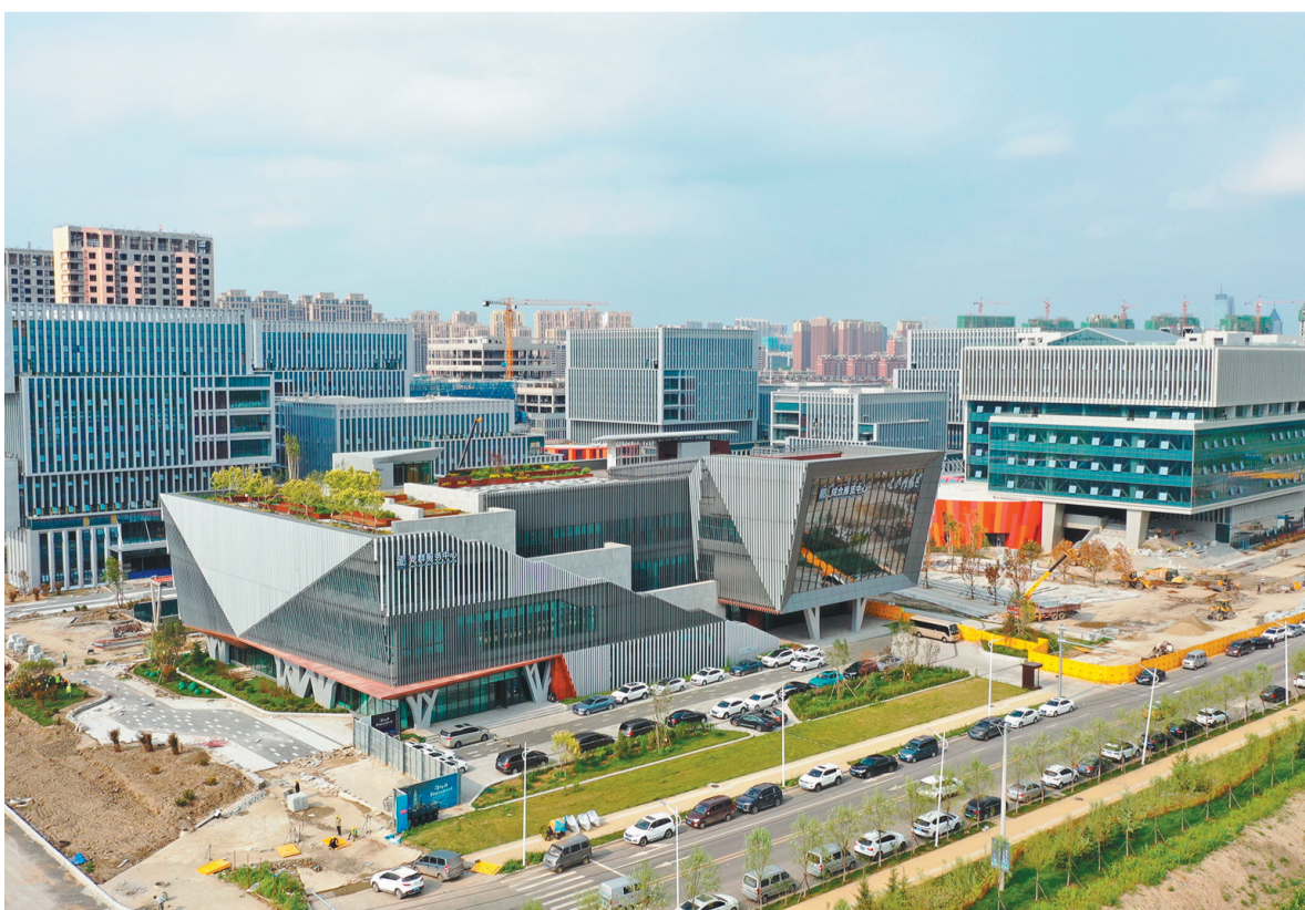
蓬勃发展的哈尔滨新区。