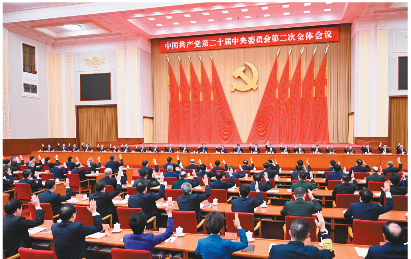
中国共产党第二十届中央委员会第二次全体会议,于2023年2月26日至28日在北京举行。中央政治局主持会议。