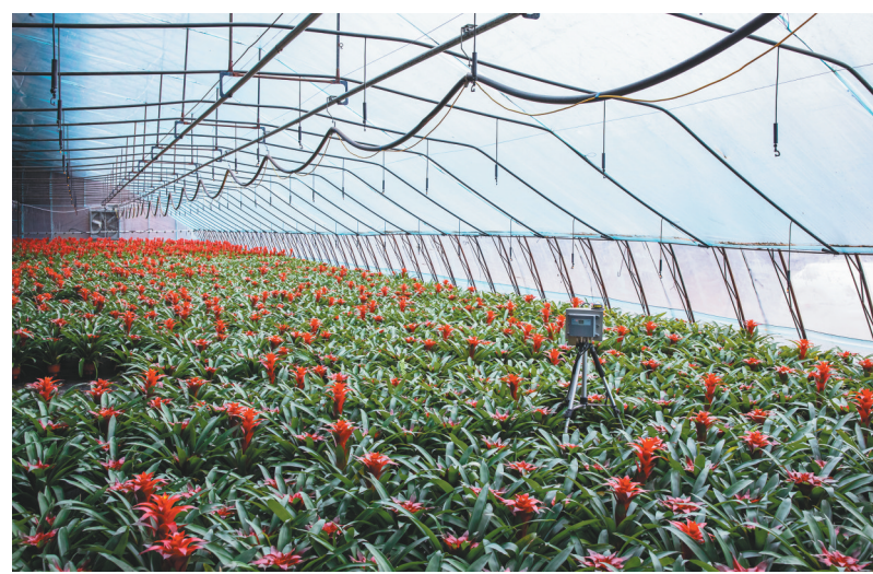
渤丰现代农业示范园春色满园。

深度开发“原字号”。依托凌钢、炜盛、中玻等龙头企业带动,强化与长城所、辽工大、南玻院等智库合作,完善产业图谱,推进产业链延展,提升产品附加值,加快推进高性能玻纤产业园、浩冶特种玻璃等项目,启动数字化改造企业10家,完成15家,加快形成新的经济增长点。培育壮大“新字号”。深入实施新动能培育计划,敢于向“新”而动,“无中生有”,加快推进无人机、中鑫华产业园、高科技激光产业园等新动能项目,积极引进一批科技含量高、发展前景好的关联项目,集“点”成“链”,集“链”成“群”,努力跑出高质量发展“加速度”。