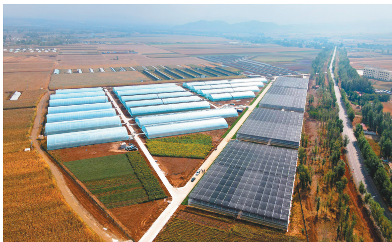
地处凌源市小城子镇的现代农业产业园。