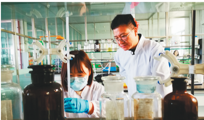
辽宁安井食品有限公司科技人员在进行产品研发。