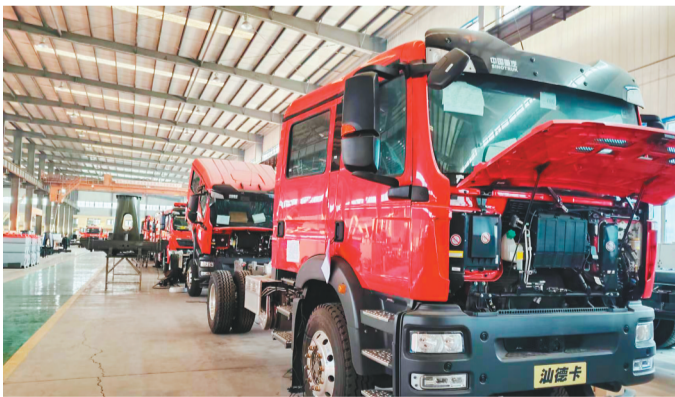
鞍山衡业专用汽车制造有限公司自主研发的举升抢险主战消防车。