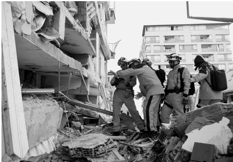
图为中国救援队队员在土耳其哈塔伊的一处地震废墟搜救。