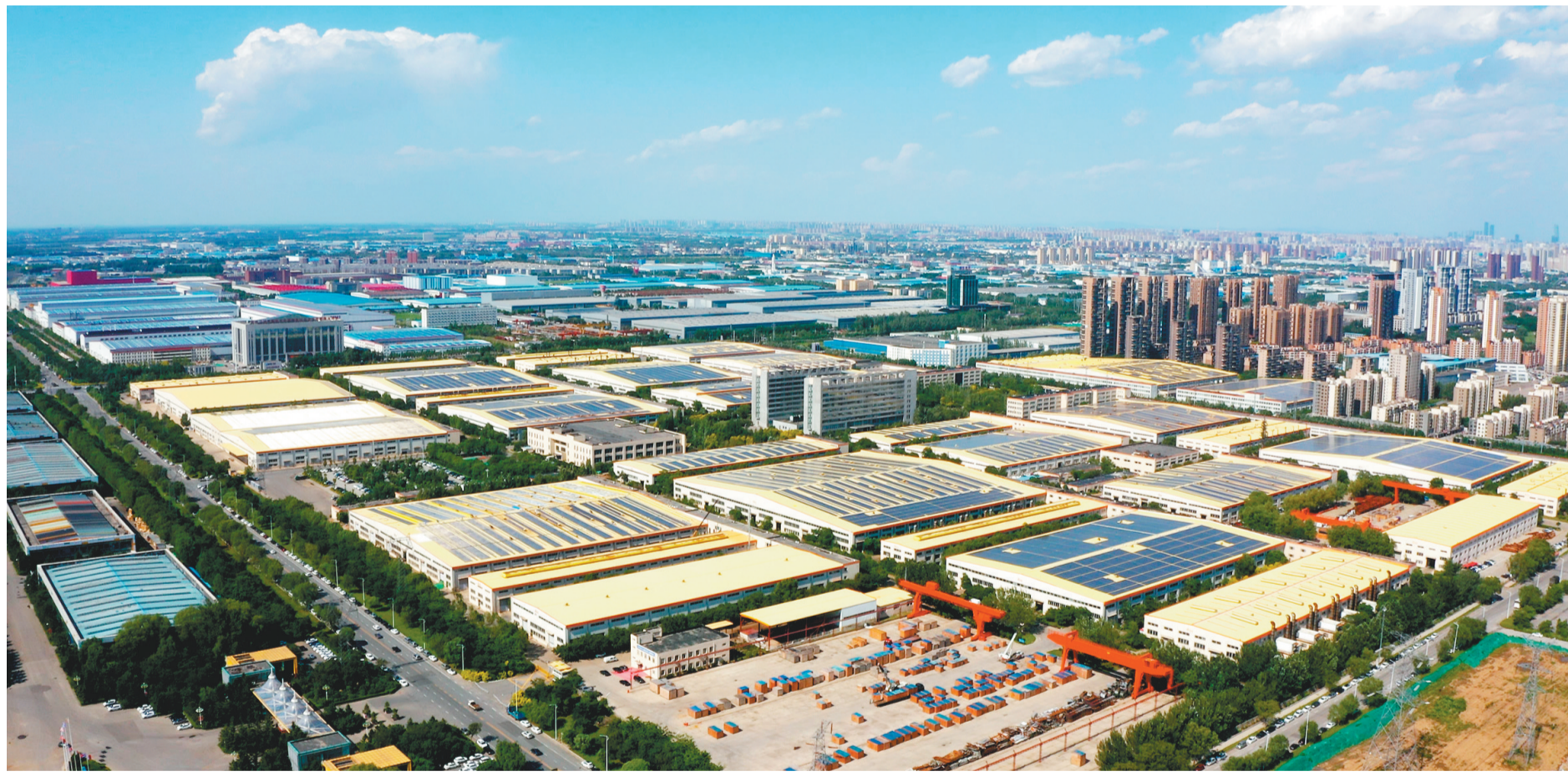
在沈阳经济技术开发区,现代化厂房鳞次栉比。