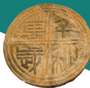
汉代“千秋万岁”瓦当