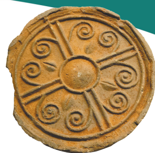
秦代卷云纹筒瓦当面