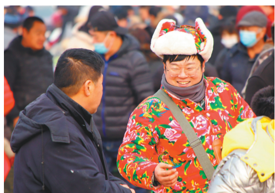
把浓浓的年味儿穿在身上，写在大集里。