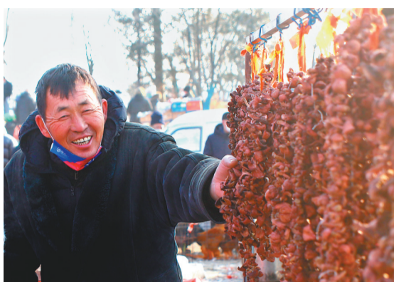
一串串蘑菇映出收获的喜悦。