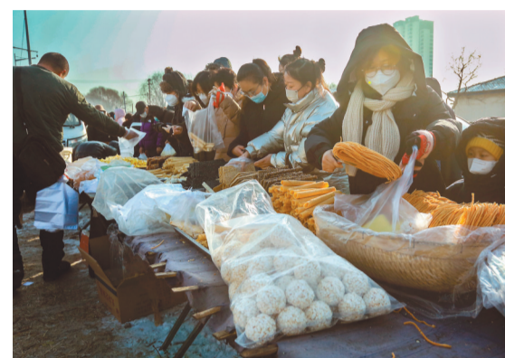
大集里的年货更多的是家的味道。