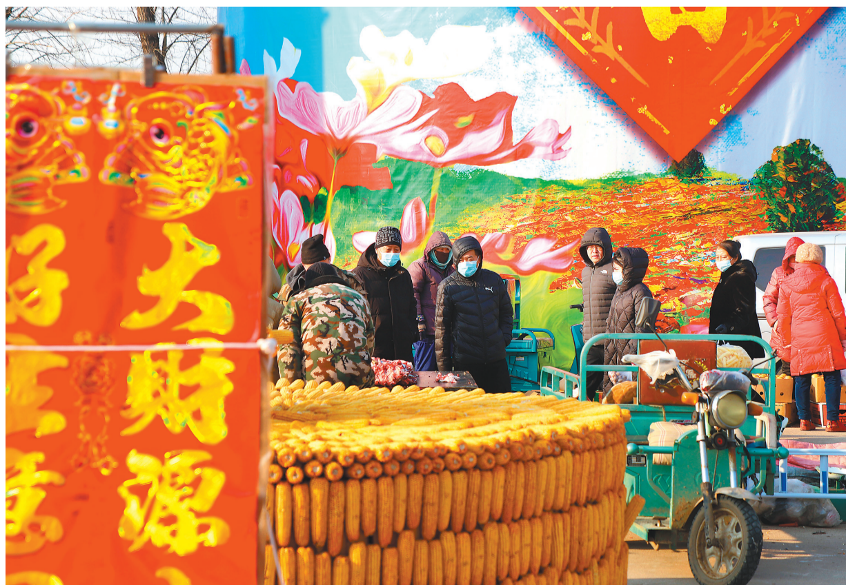
沈阳祝家大集上满满都是“丰收的味道”。