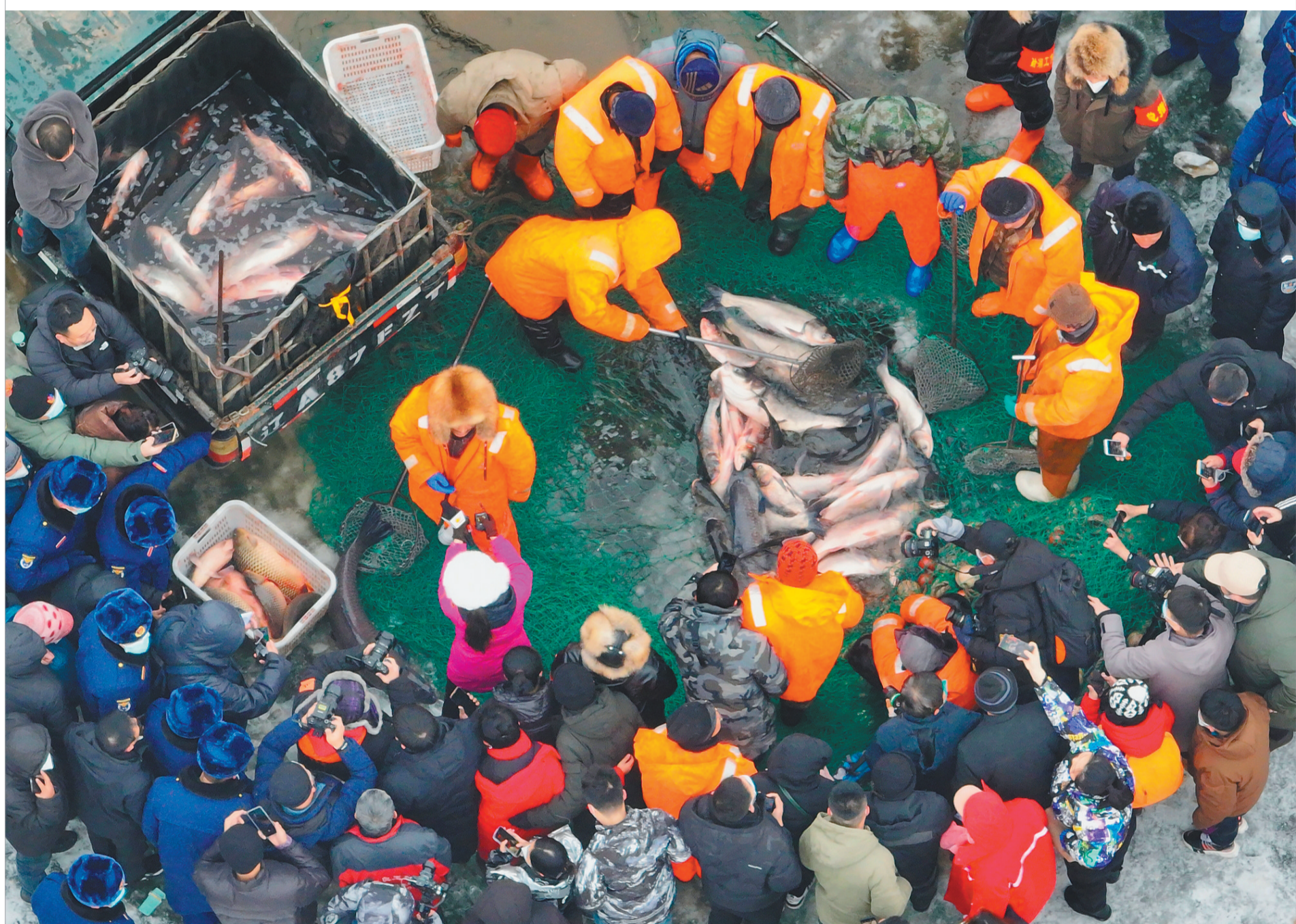
法库财湖水库捕鱼节又是收获满满。