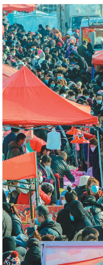
热热闹闹赶大集，欢欢喜喜过大年。

忙碌一年，为了迎接春节这个最盛大的节日，人们早早地就开始准备过年所需要的一切。在充满年味的摊位前，熙熙攘攘的人潮带来一场消费的狂欢。伴随着此起彼伏的吆喝声，人们边走边看、边逛边买，脸上洋溢着笑容满载而归。带有“兔”元素的商品最受青睐，猪牛羊肉、鸡鸭鱼蛋等也必不可少……乡村年货大集，不仅是一个消费者的市场，更传递着过年的喜庆和脉脉温情。