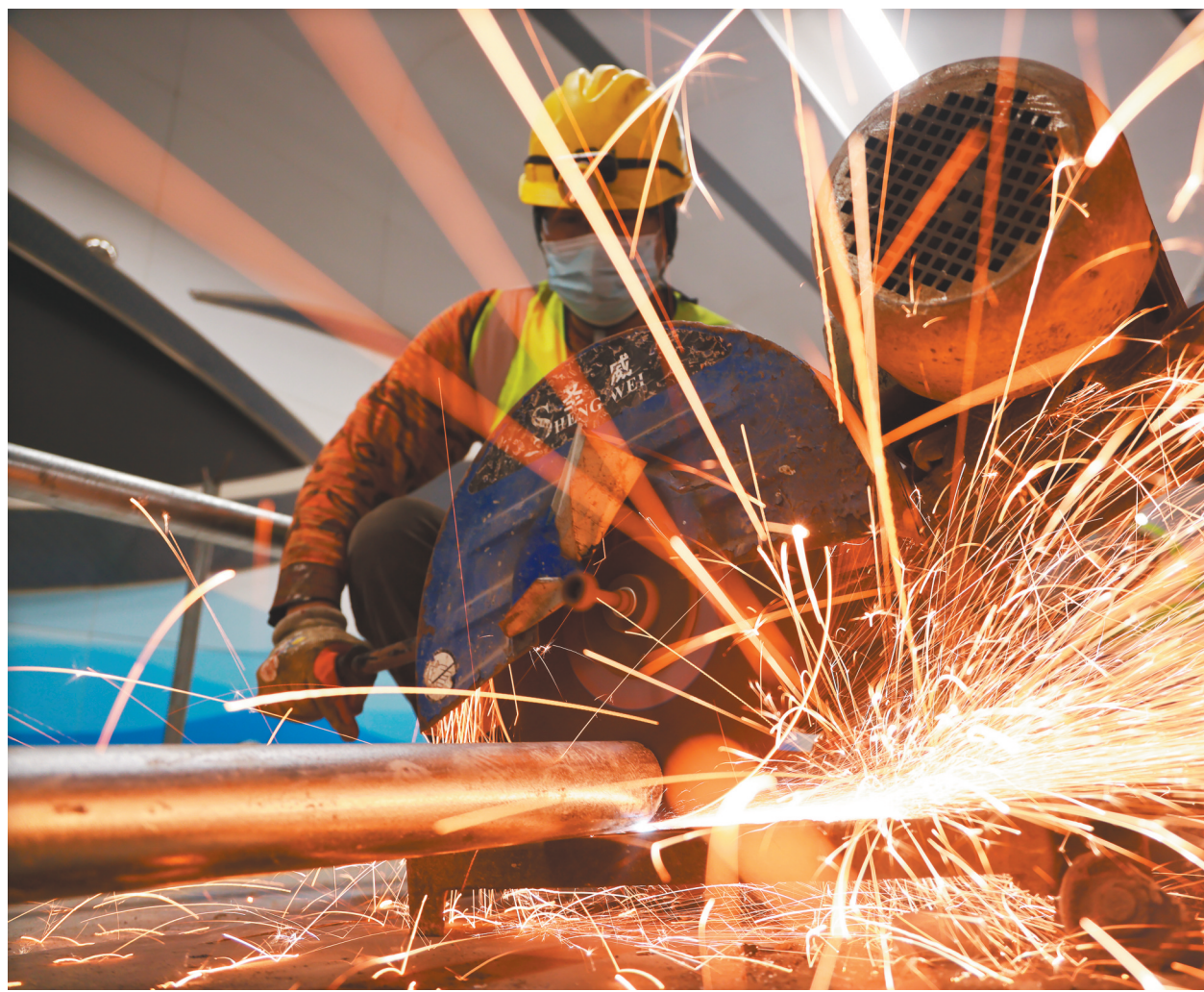
大连地铁五号线正加紧施工,力争早日实现通车。