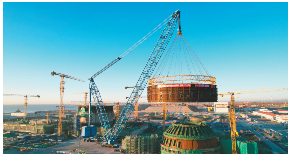
1月9日,辽宁徐大堡核电项目3号机组模块四于6时16分正式起吊,历时4个多小时顺利吊装就位,提前完成2023年首个任务节点。