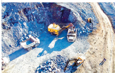
本钢矿业歪头山矿的工人们正在生产作业。