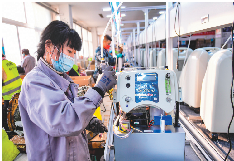
在沈阳海龟医疗科技有限公司,工人在赶制家用制氧机。