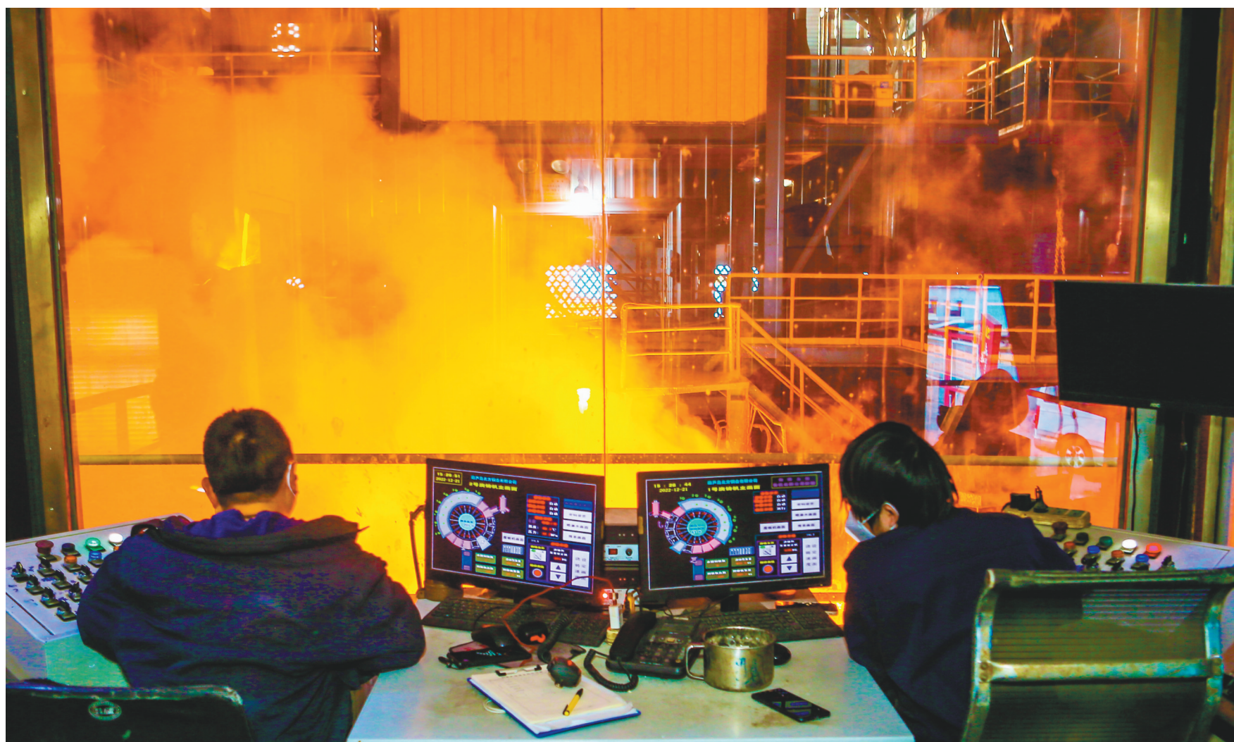
锌液沸腾、铜花绽放,中冶葫芦岛有色金属集团有限公司以新年第一周完成金属产量9582吨、化工产品产量19923吨的崭新数据精彩开局。

首战即决战,促生产,夺取开门红。时间从不辜负对拼搏者的允诺,从不吝啬对追梦人的褒奖。在这个春天,让我们奋力奔跑,迎着光明前行,开创属于我们的美好。