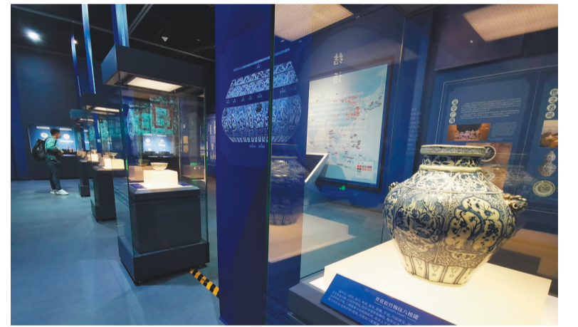
“青花清韵”展正在辽博举行。

本报讯 记者朱忠鹤报道 近日,“青花清韵”元青花瓷器展在辽宁省博物馆开展。浑厚大方、画风格豪放的青花瓷器,辅以饱满浓厚的青花蓝布景,凸显了浓郁青花瓷韵味,让人流连忘返。 此次展览是辽博馆藏元青花瓷器的首次集中展出。据统计,辽博馆藏元青花瓷器11件。本次展览中9件展品为辽博收藏,另一件为阜新市博物馆收藏。这些瓷器有传世文物,也有出土文物,其中,阜新市博物馆收藏青花瓷地老虎纹玉壶春瓶即由当地出土,是研究元青花