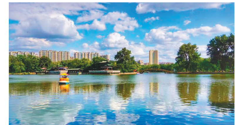
美丽的二一九公园是钢都人休闲健身的好去处。

此外,鞍山市强化科技支撑,提升精准溯源、系统治污工作效能。全市投入资金1331万元,聘请专业公司为大气治理技术支撑单位,采取“工程+管理+监测+科技+执法+督察”模式,使大气治理精准治污、科技治污能力得到大幅提升。建立起大气环境质量模拟分析、快速溯源、云数据智慧等7个平台系统,对各类污染源实现精准溯源,通过新技术装备的应用,为大气污染治理提供了有力的技术保障。