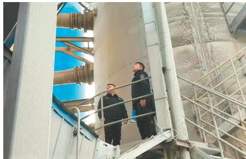
鞍山生态环境部门执法人员正在进行执法检查。

执法监管柔性化。鞍山市生态环境局坚持打击违法、保护合法原则,出台了一系列优化营商环境的政策,实施了一系列务实性举措。其中,完善了《鞍山市生态环境部门依法不予行政处罚的轻微环境违法行为目录清单》,累计对49家企业50个轻微环境违法行为免于行政处罚;制定《鞍山市生态环境局关于疫情防控期间实施柔性执法的通知》,对受疫情影响的10项环境违法行为免于处罚;落实监督执法正面清单制度,对全市符合纳入条件的51家企业在网站上公示。