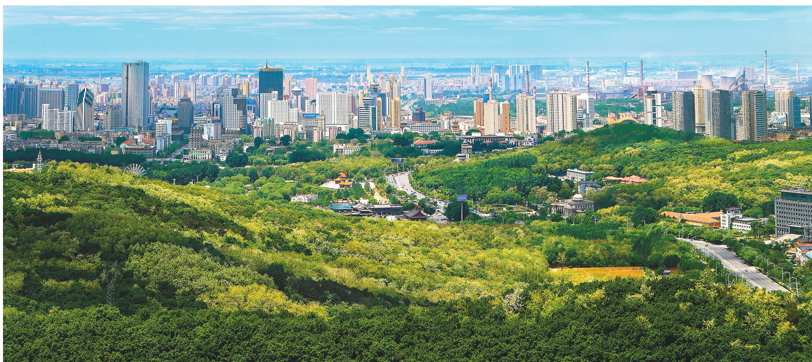
宜居宜业的美丽新鞍山。