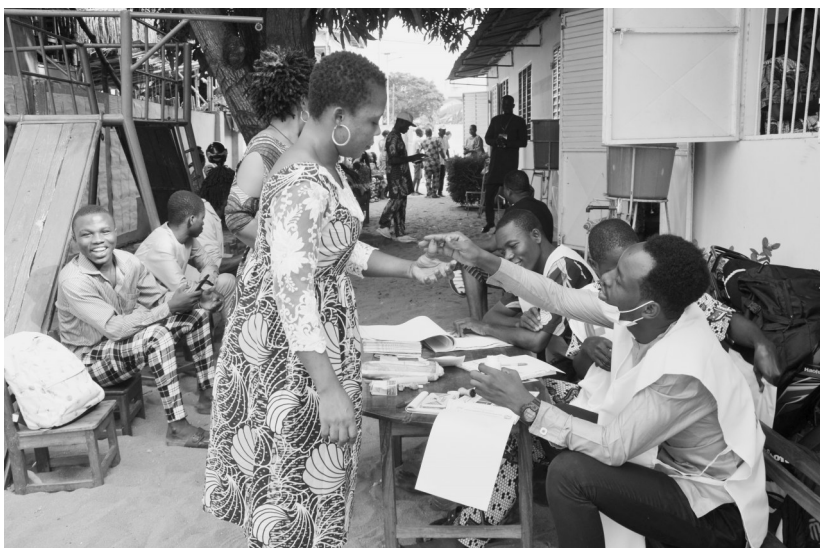
图为在贝宁科托努一处投票站,工作人员给完成投票的选民的手指涂上墨水。贝宁8日举行议会选举,来自7个政党的1500多名候选人角逐国民议会109个席位。