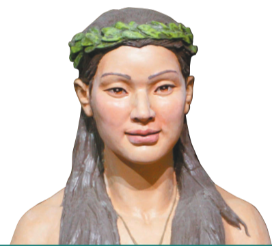
女神像复原图。(资料图)