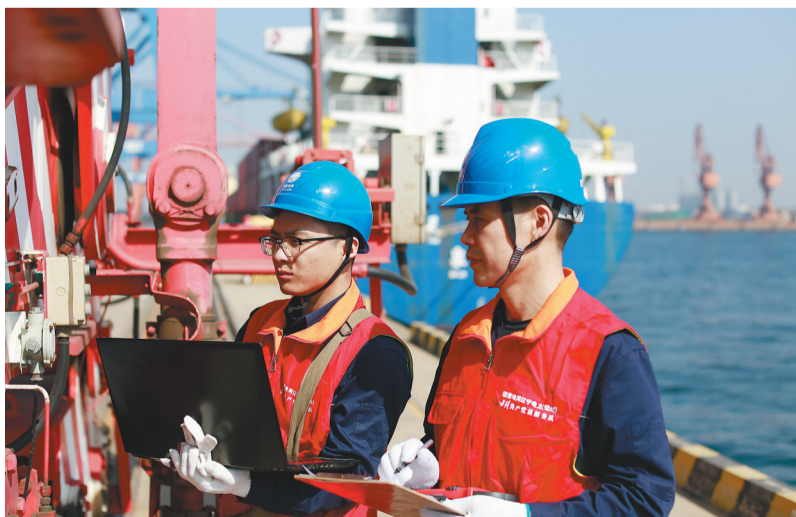
国网锦州供电公司工作人员在锦州港内检测电力设备。

本报讯 近日,国网辽宁电力综合能源公司对锦州港照明系统节能改造项目全面展开施工单位和设备采购招标。改造后,项目每年可创造节能收益170.95万元。东北陆海新通道是东北海陆大通道的重要组成部分,国网辽宁电力在服务东北陆海新通道建设过程中,与锦州港股份有限公司深化合作,携手推动“双碳”目标落地而开展的首个投资类综合能源服务项目。