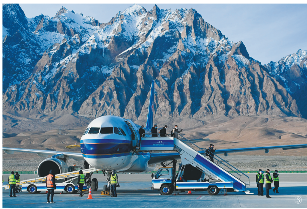
12月23日10时59分,一架自乌鲁木齐起飞的CZ5193次航班平稳降落在塔什库尔干红其拉甫机场,雪域高原帕米尔迎来首批“空中来客”。这标志着新疆首座高原机场正式通航。