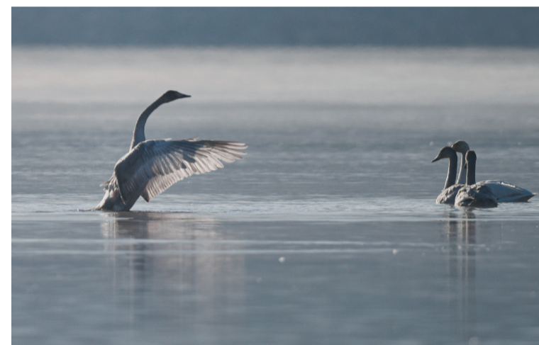
12月23日,大天鹅在青海省化隆回族自治县群科镇的黄河水面上休憩觅食。近日,青海省海东市化隆回族自治县群科镇的黄河上迎来近百只越冬的大天鹅,为冬日高原增添了一抹生机。